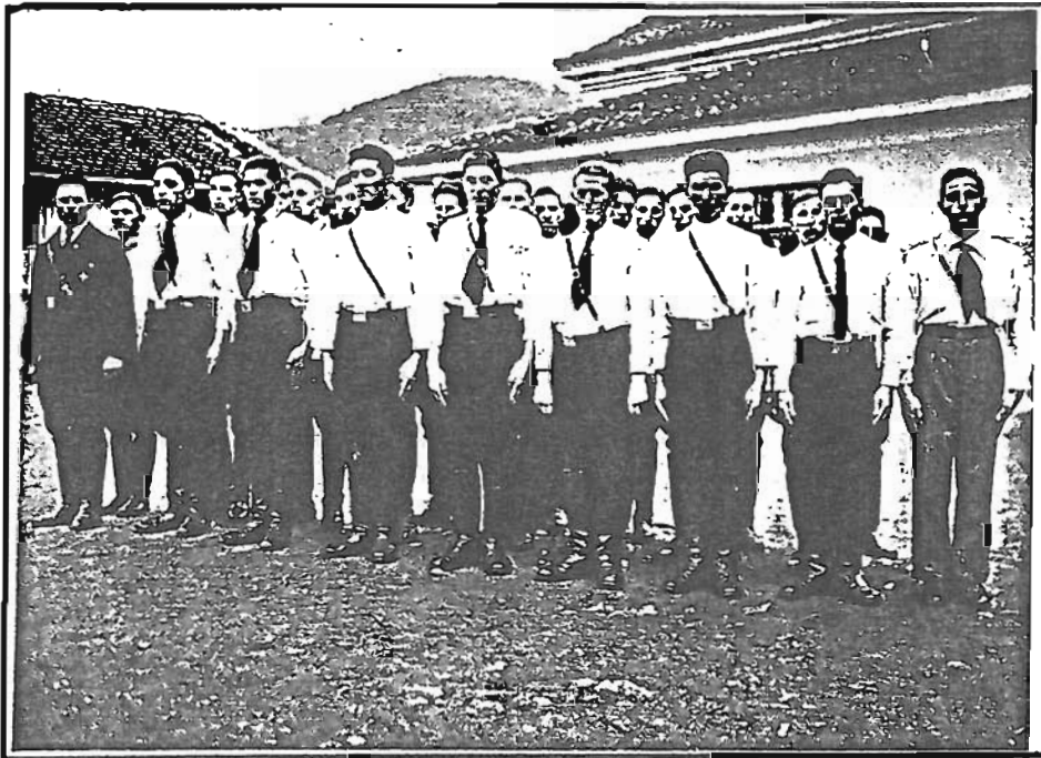
1941-Sächsische Burschen in Talmesch

4. Da endlich ist er fertig; schnell packt er seine Bücher ein und läuft hinaus zum Garten. Juchhe! Wie lacht der Sonnenschein! Das Bäumchen wirft ihm Äpfel zu, der Vogel singt und nickt ihm zu. Der Knabe springt vor Lust und jauchzt aus voller Brust, jetzt kann ich lustig sein.